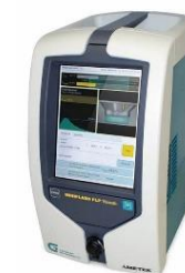
SITA MESSTECHNIK Sita-dynotester+

Messung des Flammpunktes Mesure du point éclairé Misura della viscosità dinamica Measurement of flash-point